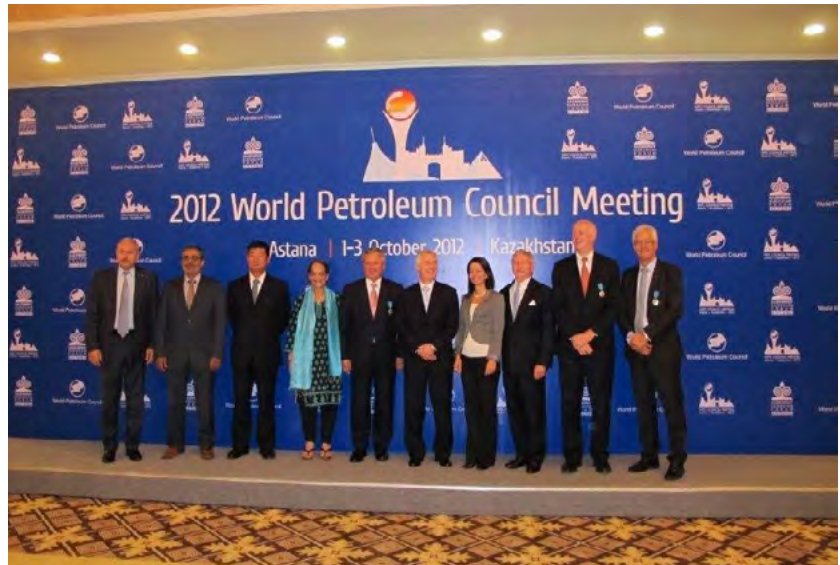
کمیته‌ی اجرایی شورای جهانی نفت (۲۰۱۴-۲۰۱۱)

شورایی است که از هر یک کمیته‌های ملی عضو دارد.