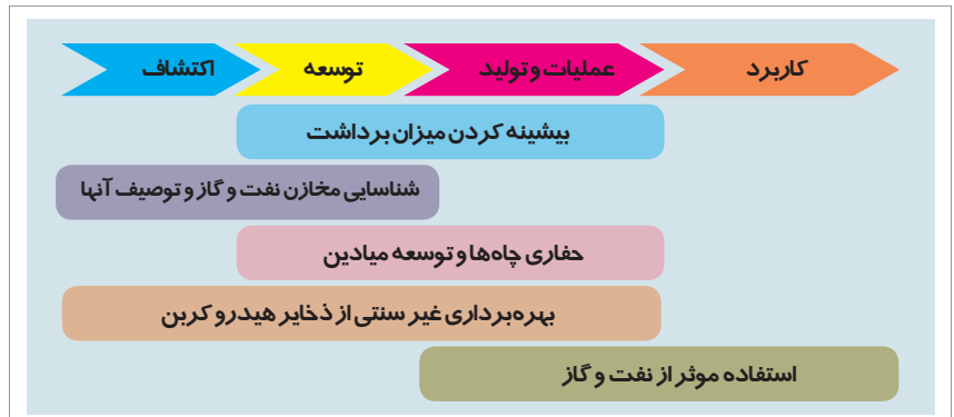
شکل ۱ | اولویت‌های کشور ژاپن در صنعت بالادستی نفت و گاز