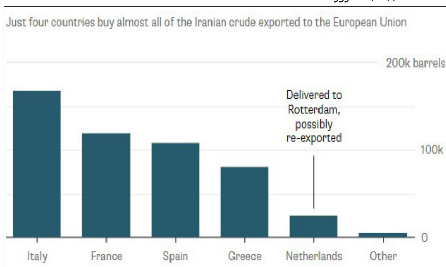
شکل ۲ | خریدهای عمده‌ی کشورهای اروپایی از ایران