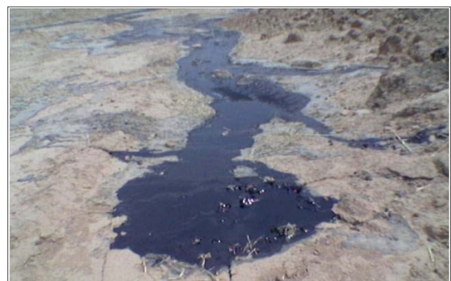
شکل ۲ | اولین چاه نفت ایران، مسجدسلیمان، سال ۱۲۸۷ خورشیدی [۷]